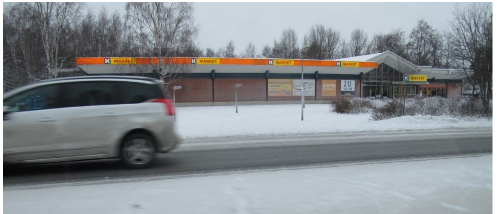
Kuva 2. Näkymä tontille Kangasalantieltä, © Tampereen kaupunki 2018.

Tontti 4620-1 on pinta-alaltaan 5676 m 2 , tehokkuusluku kaavassa e=0,3. Rakennusoikeutta tontilla on 1703 k-m 2 . Tontilla sijaitsee tällä hetkellä n. 1695 k-m 2 laajuinen liikerakennus ja pysäköintialue. Liikerakennus on valmistunut vuonna 1981.