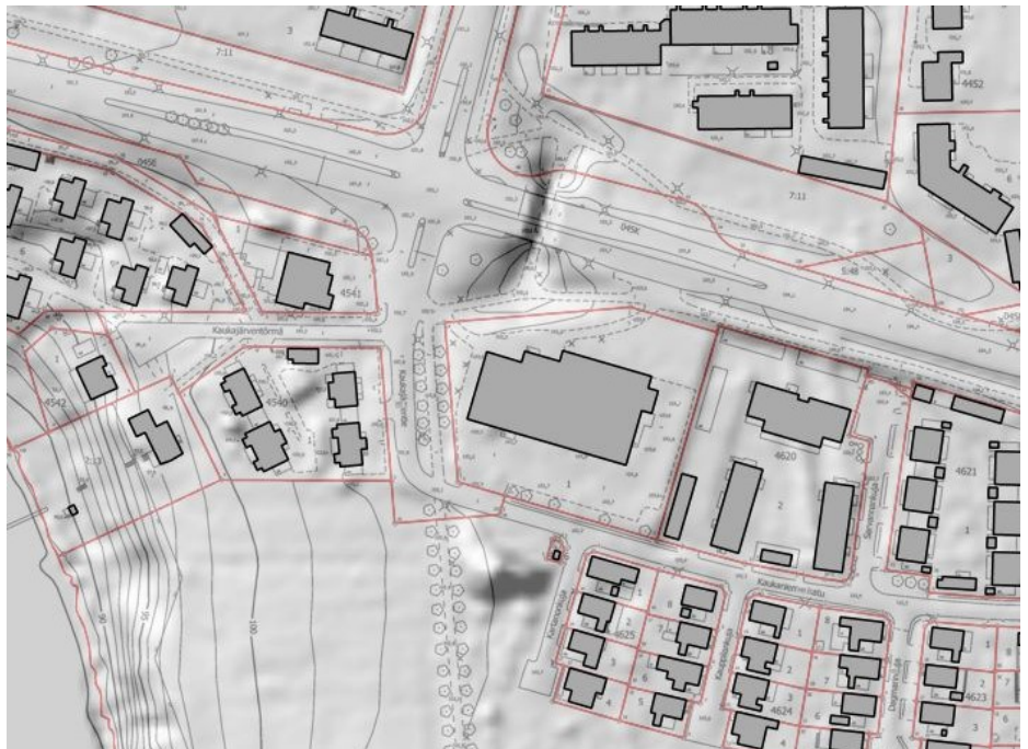
Kuva 1. Suunnittelualueen topografia. Alue on korkeussuhteiltaan tasaista. Tontin pohjoisreunassa sijaitsee Kangasalantien alittava tunneli.

Tontti sijaitsee rakennetulla alueella ja on maastoltaan tasainen. Välittömässä läheisyydessä, Kaukaniemenkadun eteläpuolella sijaitsee osittain luonnonmukainen Kaukaniemen kartanpuiston alue.